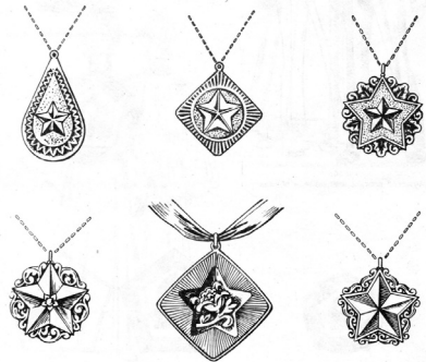
Рис. 4. Именные звездочки для новорожденных

Творцы новой обрядности, видимо, вспомнили и «звездины» 1920-х годов. Во всяком случае, для проведения обряда торжественной регистрации новорожденного был рекомендован новый символ — именная звездочка или пятиугольный памятный знак (рис. 4). «Поскольку их прообраз — пятиконечная звезда, именная звездочка или памятный знак будут напоминать гражданину о его принадлежности к первому в мире государству рабочих и крестьян, об утверждении интернациональной братской дружбы трудящихся всех пяти континентов Земли» 21 . Звездочку носят на шее — на цепочке или на ленточке. Исполнитель обращается к младенцу: «Пусть именная звездочка озарит маленькому (имя в уменьшительной форме) жизненный путь. Как светит всем людям на земле