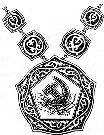
Рис. 2. Нагрудный знак исполнителя обряда

«Заведующая отд. ЗАГСа проводит регистрацию брака. На это торжество приходят много гостей, приносят много цветов. Упадет по лепестку с букета каждого, а в помещении отд. ЗАГСа уже грязно. Что же делать? Ведь сейчас придет новая пара для рег. брака. И тогда заведующая ЗАГСа на свой ритуальный костюм одевает халат, берет метлу и подметает пол в помещении. А потом принимает новую пару. А потом поступают жалобы от молодоженов, что их брак регистрировала уборщица, что заведующая где то отсутствовала. Пришлось пригласить председателя исполкома и этих молодоженов. Он пытался убедить их в том, что брак их регистрировала не уборщица, а заведующая. Они не хотели верить, утверждали, что в их присутствии этот же человек убрал помещение» 15 .